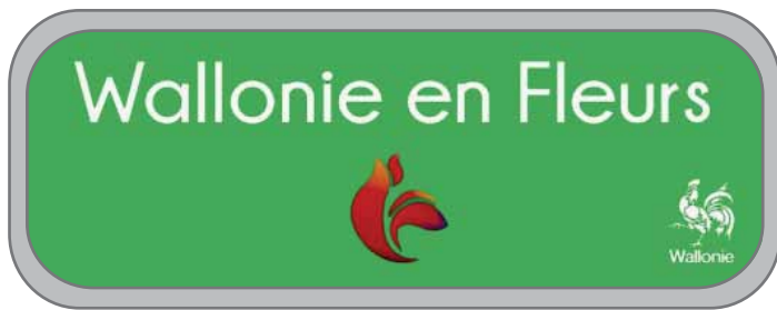
Panneau signalétique installé aux entrées des villages de la commune

La participation au concours est ouverte à toutes les administrations communales et associations locales situées sur le territoire wallon. Actuellement, cela représente pas moins de 83 villes et villages fleuris ! Le label s'inscrit dans une démarche qui permet aux participants d'améliorer la qualité de vie de leurs communes, de développer l'économie locale, de favoriser la cohésion sociale et d'agir en faveur de la protection de l'environnement.